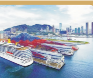
深圳蛇口邮轮中心