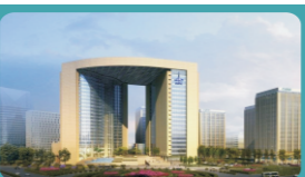
中国国际航空股份有限公司