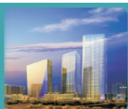
深圳国际创新中心