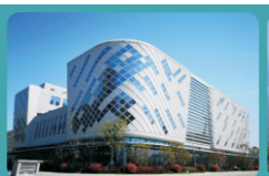
合肥中关村创新智汇园