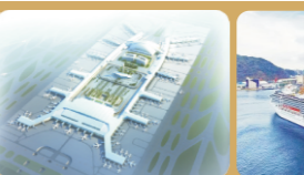
广州白云国际机场