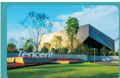
腾讯武汉研发中心

中行 江西/山东/长沙 农行 天津/山东/安徽/江西 建行 武汉/安徽/山东建行 深圳工行 山东国开行 四川邮储银行 四川农发行