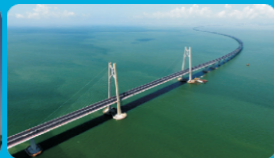
港珠澳大桥管理局